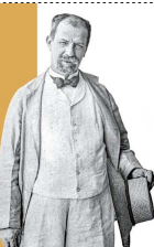
Table ronde :

Exposition dans l'église : « Sainte-Anne de la Butte-aux-Cailles, la paroisse de Paulin Enfert le serviteur de Dieu (1853-1922) »