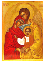
Prier avec la Sainte Famille

Pour tous renseignements : pastoraledescouples@gmail.com